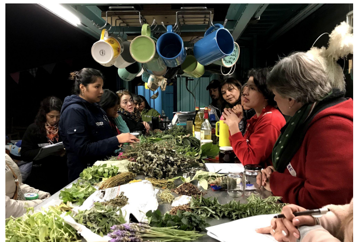
Taller de Fitoterapia / Cosmética