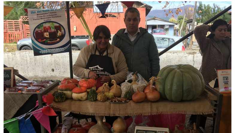
Feria de productores locales