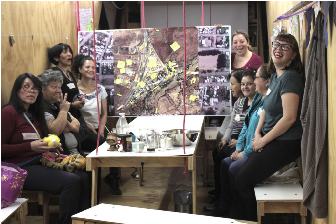
Taller de Mapeo con mujeres