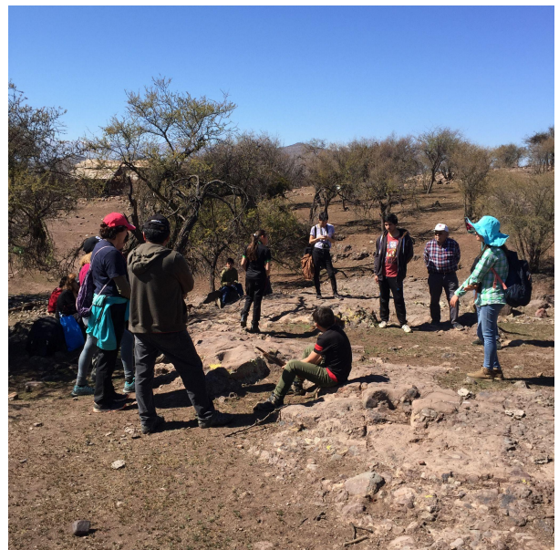
Paseo taller de arqueología