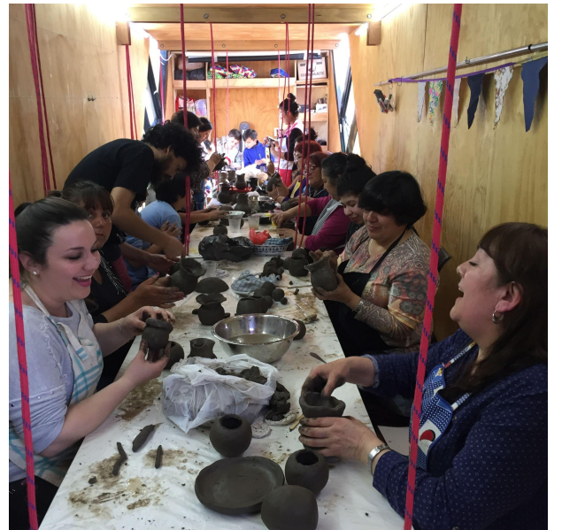
Taller de Greda