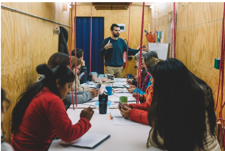
Taller de Fitoterapia / Medicina