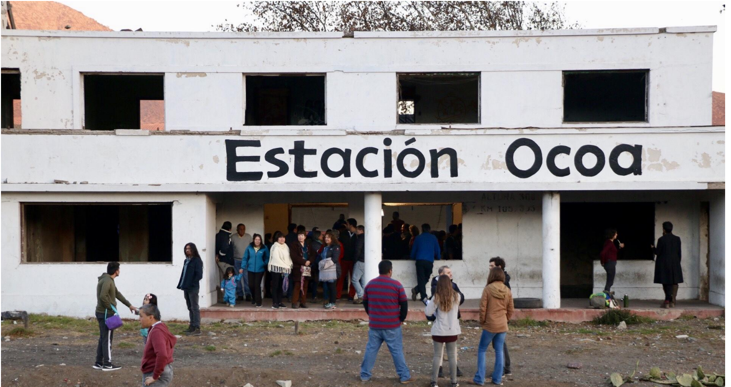
Cierre de Activación Trenzado / Ocoa