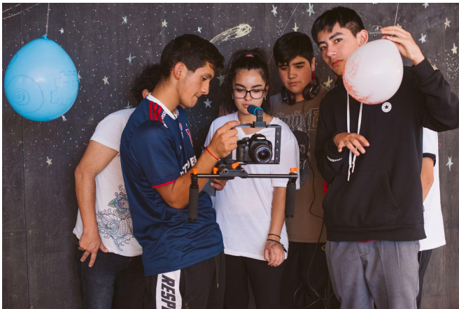
Taller de Cine

2/ Fotografías de actividades realizadas en el proyecto ACTIVACIÓN TRENZANDO / ESTACIÓN YUMBEL