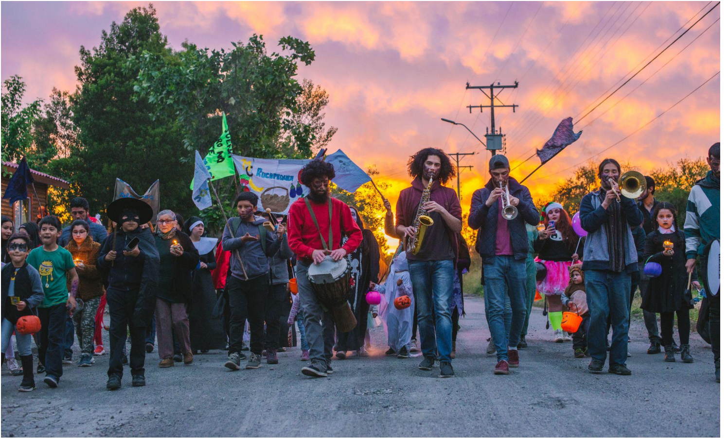
Pasacalle Noche de muertos