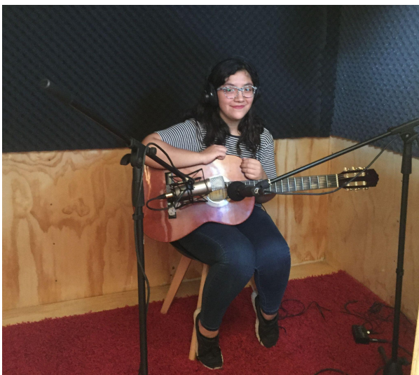
Registro fonográfico de músicos locales