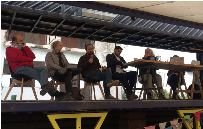
Ciclo de Charlas