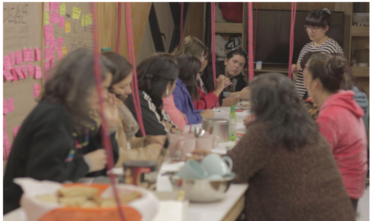
Taller de Mapeo con mujeres