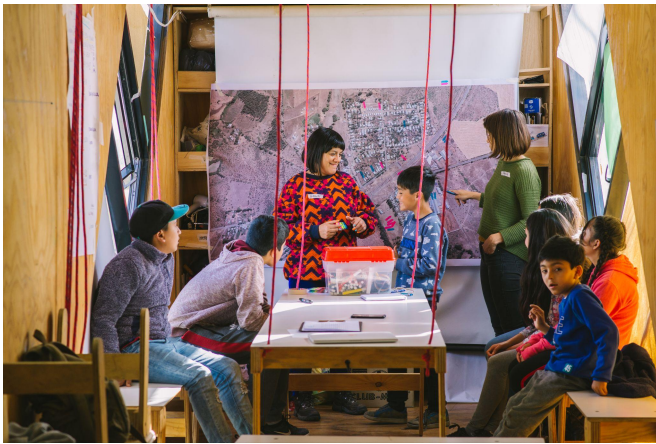
Taller de Mapeo con niñxs