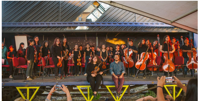
Taller de música / Orquesta juvenil