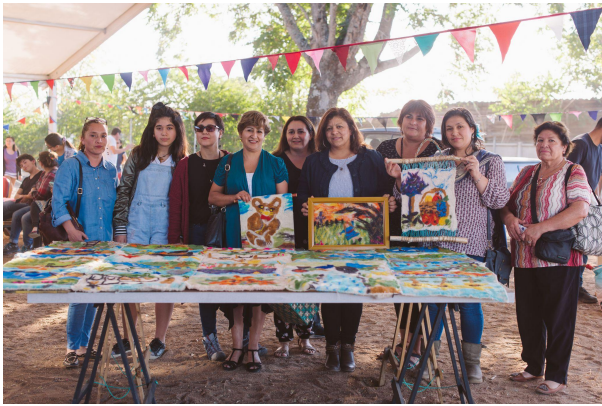
Taller de Muralismo