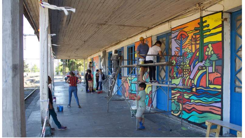
Taller de Muralismo