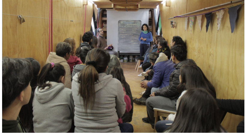
Taller de Cueca