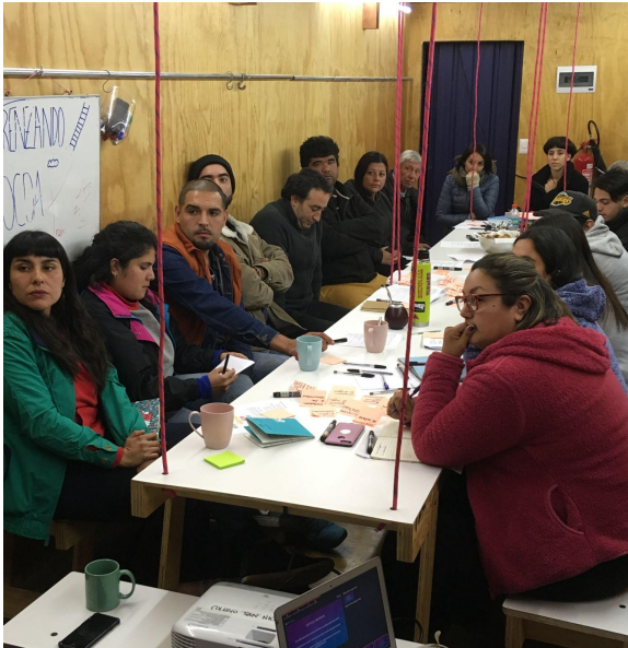
Taller de Gestión