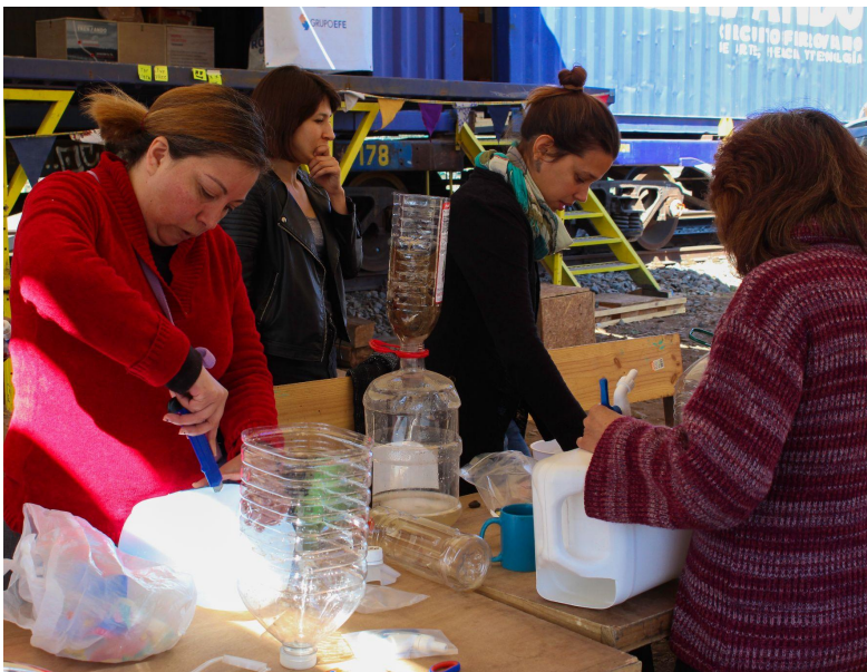
Taller Cuidado del agua