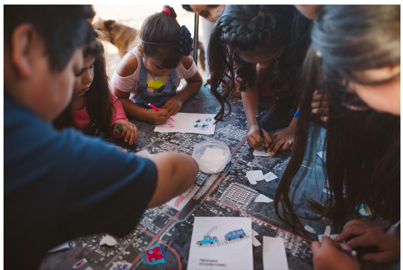
Taller de Mapeo con niños