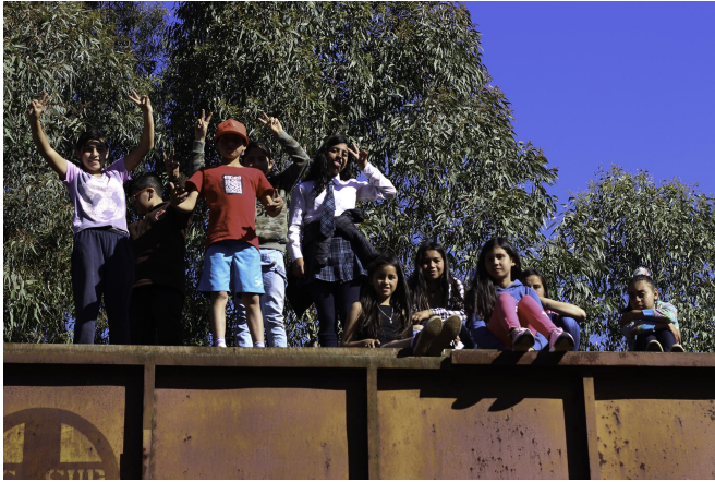
Taller de Cine