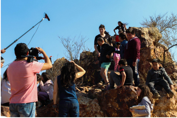
Taller de Cine