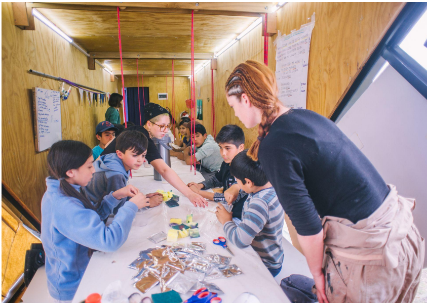
Taller de Efectos especiales