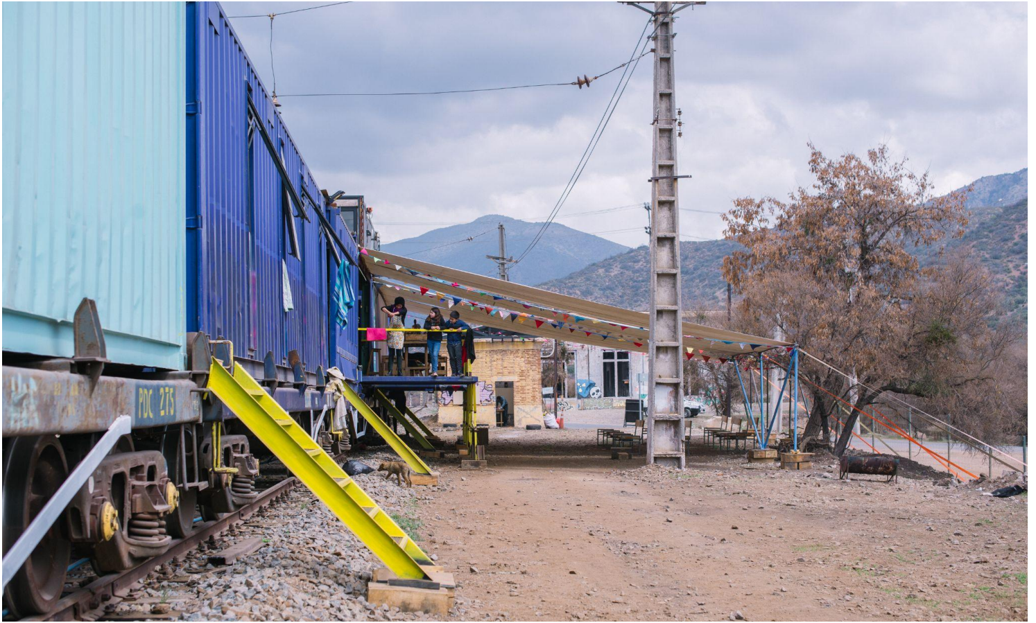
Nave Trenzando en Estación Rungue