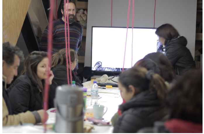
Taller de Gestión