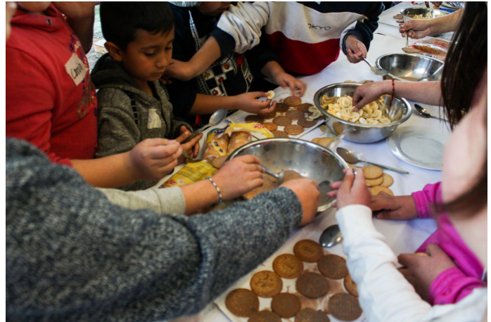
Taller de Cocina