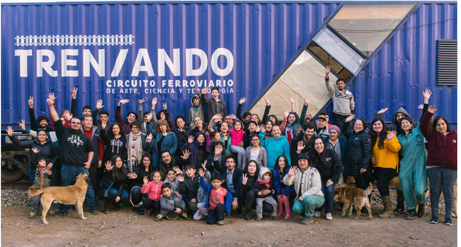
Cierre de Activación Trenzando / Rungue