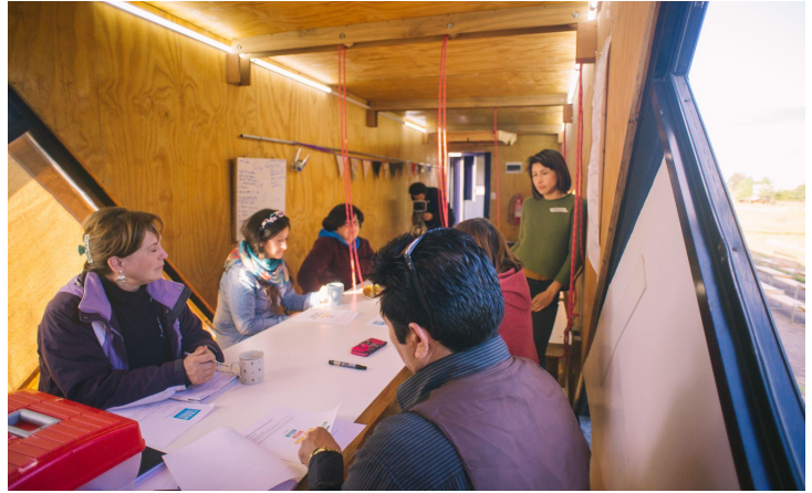
Taller de Gestión