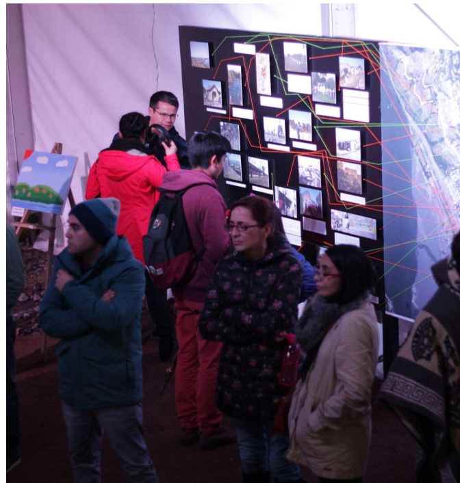
• Actividades varias